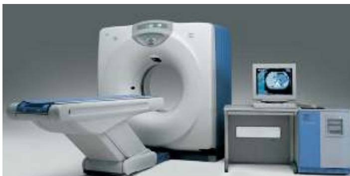
GE社製CT(コンピュータ診断撮影装置)New Prospeed II