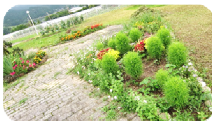
▲入居者様がお世話されている庭